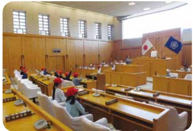
▲小学生議場見学の様子