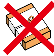
歳 暮 ・ 年 賀