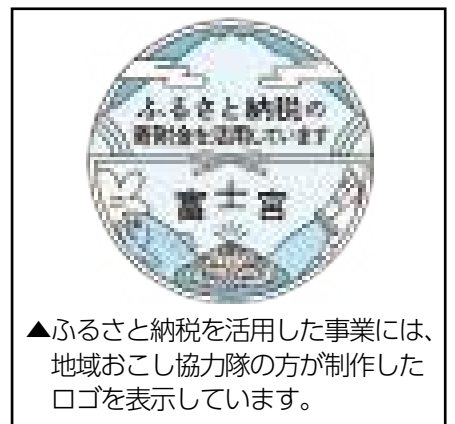
▲ふるさと納税を活用した事業には、地域おこし協力隊の方が制作したロゴを表示しています。