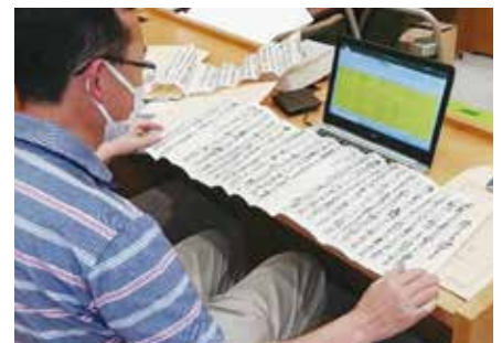
▲市の歴史や文化を後世に残すため、市史の編さんを行っています。