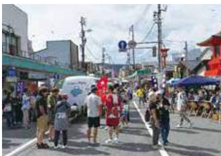
▲商店街のイベントを補助し、まちなかのにぎわいを創出しています。