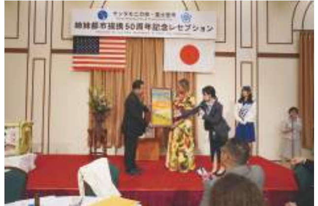
▲記念レセプションで染物を贈呈