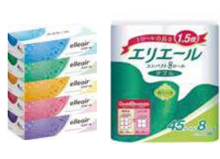
▲ティッシュペーパー、トイレトペーパー