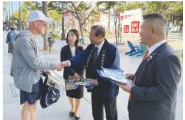
▲市長・議長が自ら富士宮市をPR