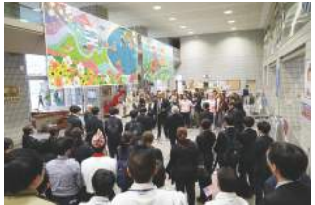
▲キッズゲルニカを市役所市民ホールに展示