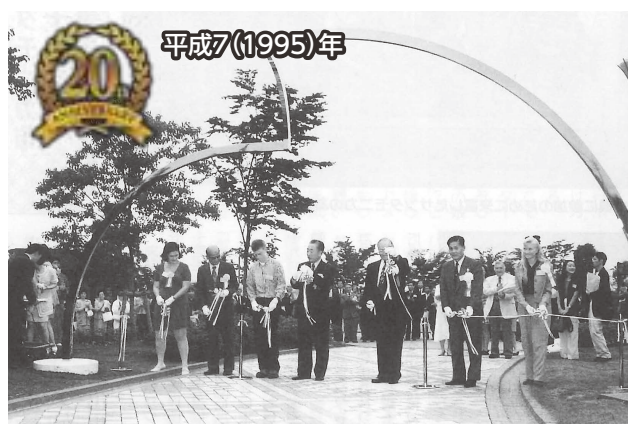
▲外神東公園に「リトル・ビッグ・ウェーブ」を設置