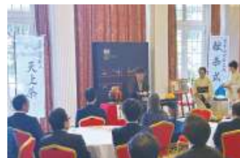
▲大使館で披露される富嶽天上茶