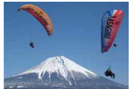
▲観光体験などの利用券

富士宮やきそばやニジマスなど、圧倒的な知名度を持つ特産品がふるさと納税の返礼品になっています。また、富士山の恵みである湧水を活かした日本酒や清涼飲料水、高品質なティッシュペーパーやトイレトペーパー、富士宮市の魅力あふれる返礼品が、全国各地からのふるさと納税を呼び込んでいます。