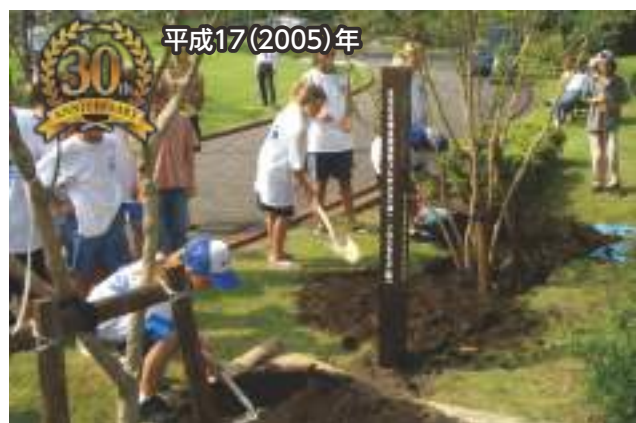
▲外神東公園にフジザクラとイロハモミジを植樹