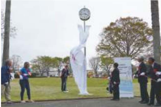
▲外神東公園に記念の屋外時計を設置

姉妹都市提携を締結して50年の記念の年である令和7年は、さまざまな記念事業が行われました。