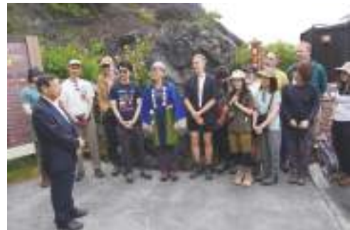
▲富士登山に挑戦する英国大使館関係者