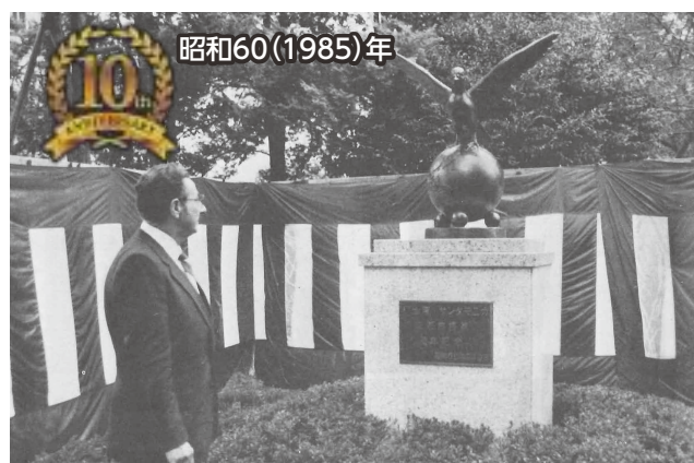
▲城山公園に「友好の像」を設置(その後、外神東公園に移設)