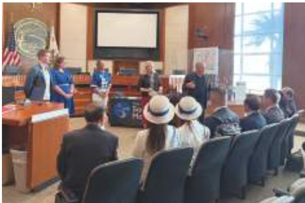
▲サンタモニカ市で歓迎を受ける富士宮市訪問団