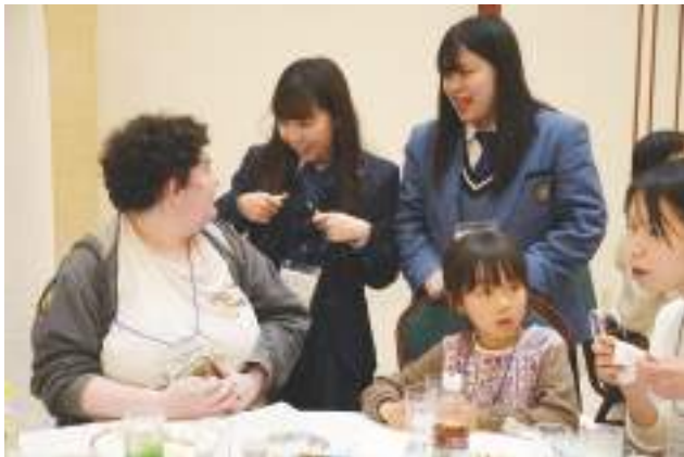
▲記念レセプションで交流する両市の高校生