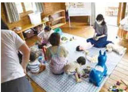
▲「生んでよし 育ててよし」のまちを目指し、妊娠・出産をサポートします。