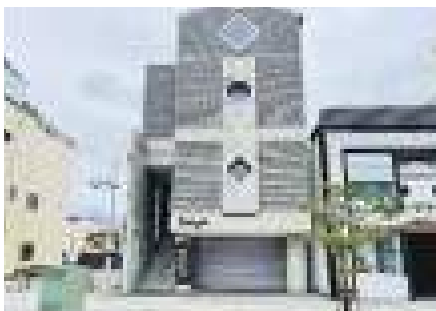
▲「エキマエチャレンジハウス チリン」を開設しました。