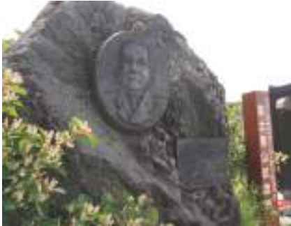
▲平成4年に富士宮口五合目に設置されたラザフォード・オールコック富士登山記念碑

万延元(1860)年、初代英国公使のラザフォード・オールコック卿が外国人として初めて富士山に登頂しました。この歴史的な出来事がきっかけで、平成4年の市制施行50周年の際、英国大使館関係者を富士山お山開きに初めて招待しました。以降、英国大使館関係者が毎年お山開きに参加しており、オールコック卿の富士登山のご縁から、富士宮市と英国の交流が続いています。