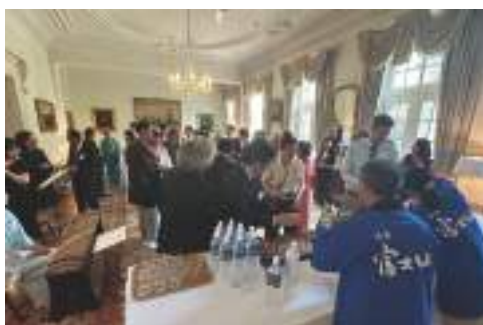
▲大盛況となった日本酒の試飲コーナー

また、富士宮産の日本酒の試飲も実施されるなど、富士宮市のPR活動が行われました。