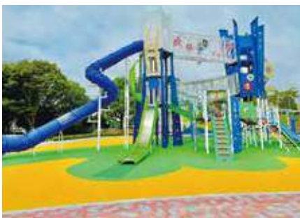
▲外神東公園に、県内最大級の大きさの複合遊具を設置しました。