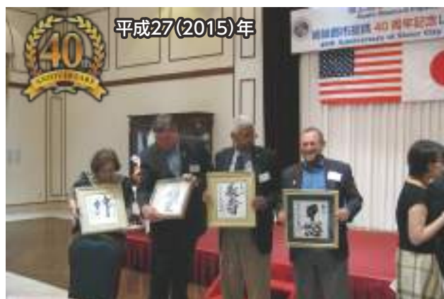
▲40周年を記念し、レセプションを盛大に開催