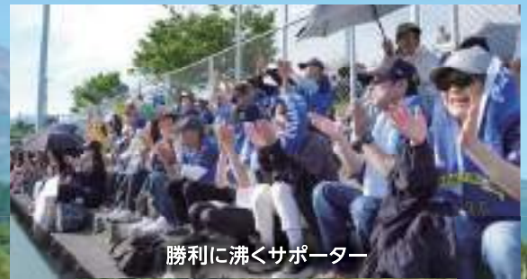
勝利に沸くサポーター