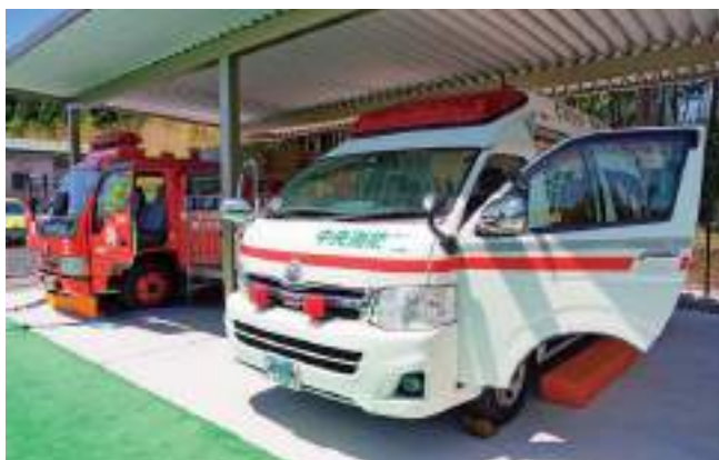
▲展示している車両は、火災や救急の現場で活躍し、役目を終えた車両です。

開園時間 土曜日および日曜日 10:00～12:00、13:00～15:00 (年末年始などを除く。予告なしで、臨時休園する場合があります。) 場所 富士宮市原523(白糸自然公園内)