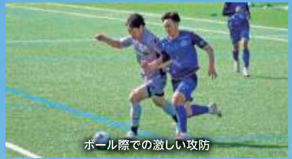
ボール際での激しい攻防

集まったサポーターと勝利の喜びを分かち合い、富士山の麓から、モスペリオの挑戦が始まりました。