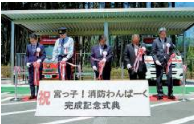
▲完成記念式典の様子