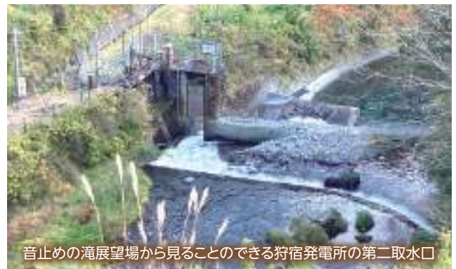
音止めの滝展望場から見ることのできる狩宿発電所の第二取水口