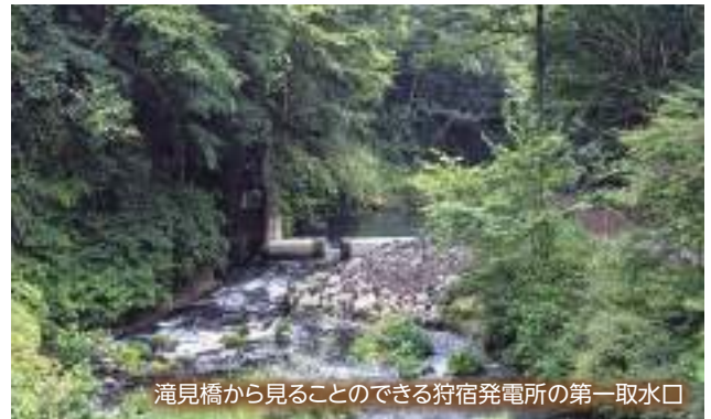
滝見橋から見ることのできる狩宿発電所の第一取水口

大正8(1919)年に建てられた狩宿発電所は、白糸の滝と音止めの滝の下流にあり、現在も使用されています。