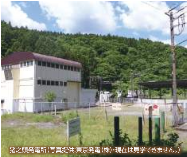
猪之頭発電所(写真提供:東京発電(株)・現在は見学できません。)

大正8(1919)年に建てられた狩宿発電所は、白糸の滝と音止めの滝の下流にあり、現在も使用されています。