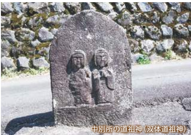
中別所の道祖神(双体道祖神)

中別所では、昭和初期まで、特に厄年の親が子どもの健やかな成長を祈り厄を払うために、生まれて間もない子どもを一旦道祖神の前に寝かせ、知人などに拾い上げてもらう風習がありました。