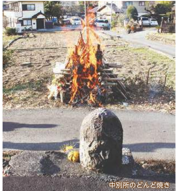
中別所のどんど焼き

どんど焼きは道祖神の祭りともされ、中別所でも道祖神の前でどんど焼きが行われます。