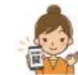
スマホアプリ決済 (二次元バーコード)