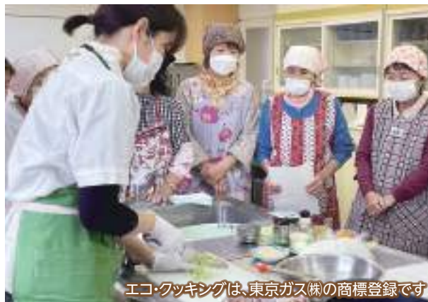
エコ・クッキングは、東京ガス(株)の商標登録です

市では、事業者の協力を得て、「エコ・クッキング講座」を開催しています。普段は捨ててしまう野菜の皮や茎、魚の頭を使って調理したり、汚れた調理器具を要らない布で拭きとってから洗うなど、「買い物・料理・食事・片付け」の過程で、食品ロスや電気・ガス・水などの使用量を減らす方法を学びます。