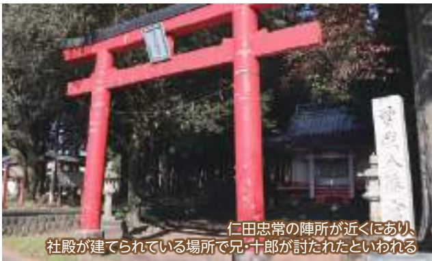
仁田忠常の陣所が近くにあり、社殿が建てられている場所で兄・十郎が討たれたといわれる

頼朝は、幼い時に父を亡くし、長年の苦難の末に父の仇を討った兄弟の姿に感心し、1197(建久8)年、畠山重忠を派遣して、地元の住人にここに兄弟を祀らせたといわれています。