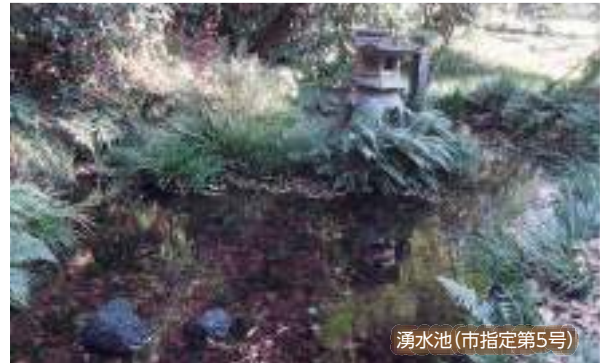
湧水池(市指定第5号)

「出水」という地名が物語るように、この境内には湧水池があり、岩場の奥には、水の神である弁才天が祀られています。