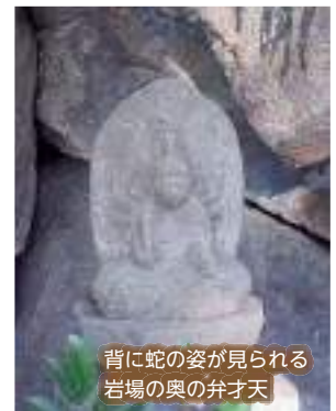
背に蛇の姿が見られる岩場の奥の弁才天