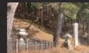
▲藤原光親卿の墓への入口