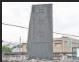
▲平家越の石碑(今泉)

水鳥が飛び立った音に驚いた平家軍が敗走した場所である「平家越」と平家方が物見(見張り)をした「物見堂」、頼朝が鎧を脱いで体を洗ったとされる鎧ヶ淵親水公園、13人のうちの1人である和田義盛にちなんだ地名や神社など市内にはゆかりの地が数多くあります。市内各所を巡り、富士川の合戦に思いを馳せてみませんか。