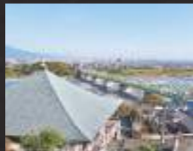
▲物見堂(岩淵)は、市内が一望できる絶景スポット