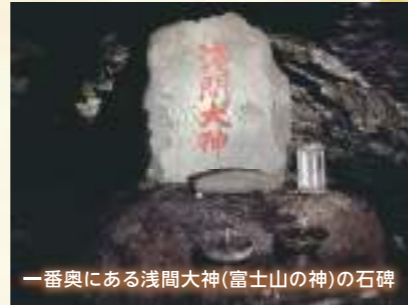
一番奥にある浅間大神(富士山の神)の石碑