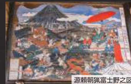
源頼朝狩富士野之図

源頼朝が現在の御殿場市周辺の富士山麓で行った大規模な巻狩は、富士の巻狩と呼ばれています。源頼朝が朝廷から征夷大將軍に任ぜられ、名実ともに鎌倉に幕府が開かれたのは、建久3(1192)年。その翌年、富士の巻狩が行われました。市内には、富士の巻狩やその時代にまつわる旧跡や伝承が数多くあり、富士の巻狩と関係があるとされる地名も数多く残っています。