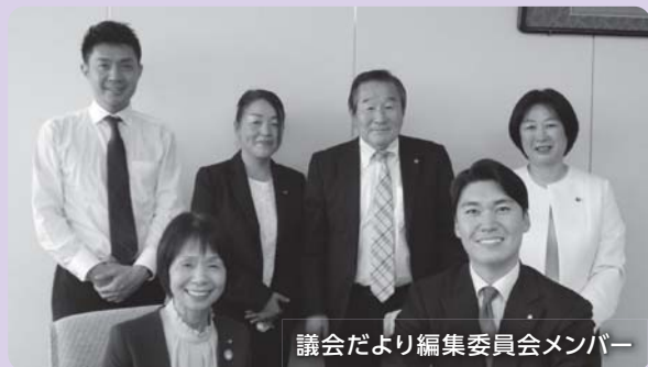
議会だより編集委員会メンバー

議会だより編集委員会が6人のメンバーで動き始めました。市民に身近な寄り添う議会を目指し、「常に市民と共に」を心に、わかりやすい議会報告と議員の様子をお知らせしたいと思います。より多くの皆様に、議会と22人の議員に興味を持っていただけるような議会だより作りを目指します。