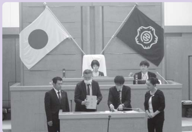
▲議長選挙開票の様子

市議会スタート後の初議会は、5月18日に臨時会として招集され、正副議長選挙、常任委員会委員、議会運営委員会委員の選任などが行われました。