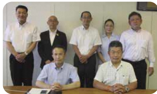
▲新議会だより編集委員会

私は編集委員を務めさせていただくのは今回で3回目になります。いかに多くの市民の皆様に、議会を身近に感じていただき、本誌を手にとって読んでいただけるかということが一貫した課題であると感じております。世の中が大きな転換期にある今、議会だよりも柔軟に変化し、志に向かって進んでいきたいと思っております。