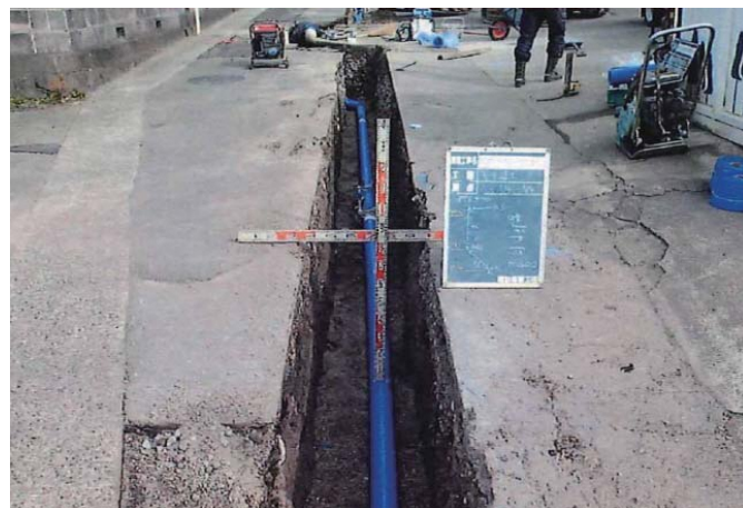
▲地震に強い水道管への更新