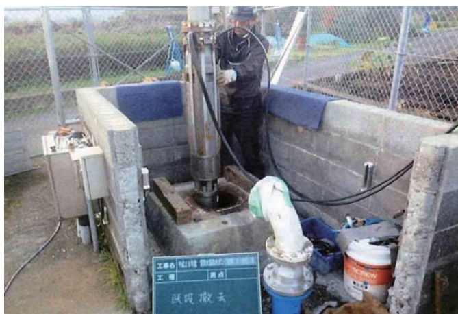
▲水を汲みあげる水中ポンプの更新