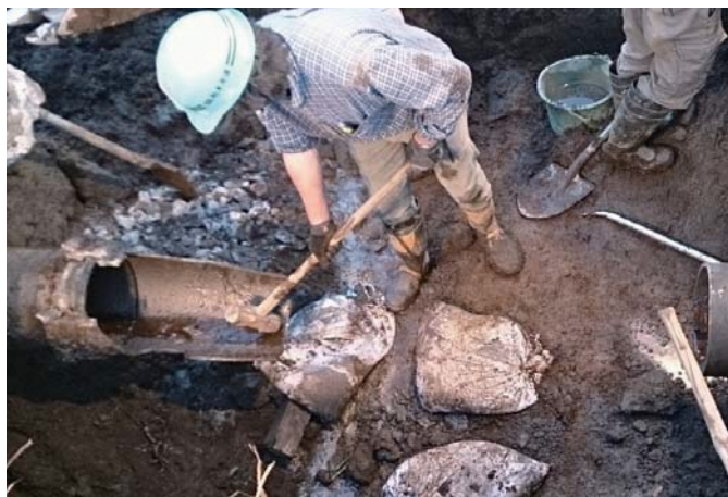
▲漏水した水道管の修繕工事