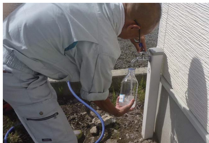
▲水質検査のための採水