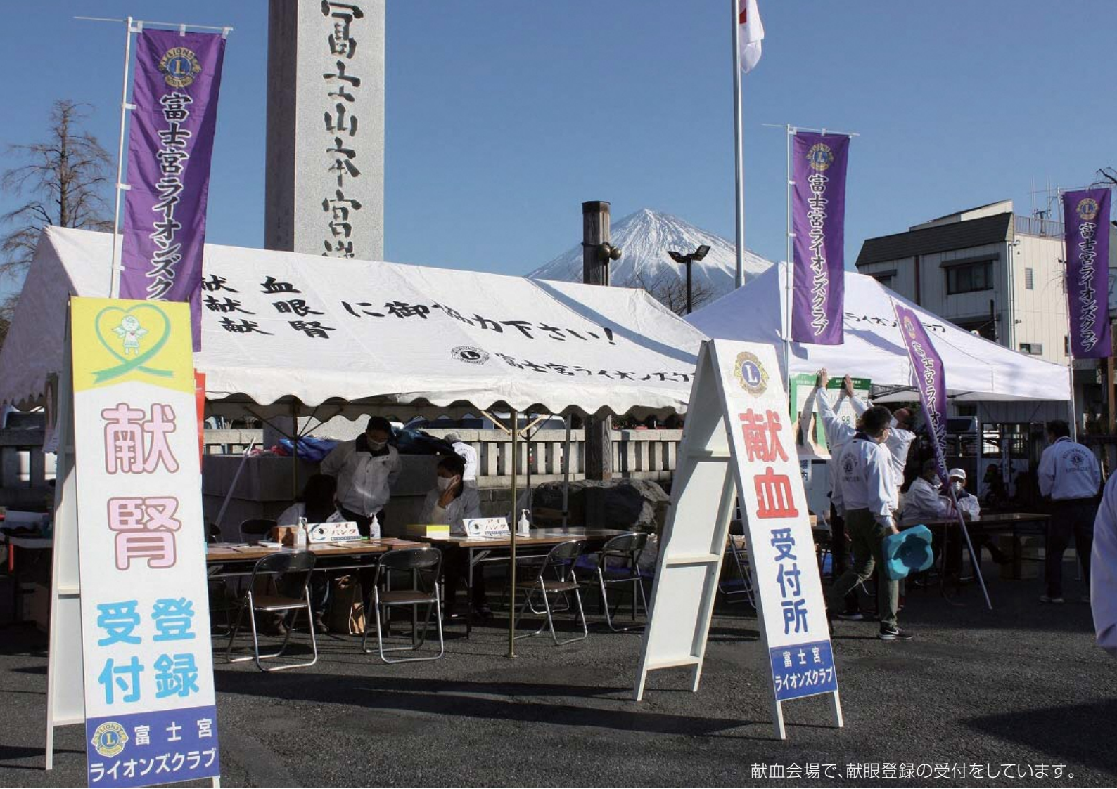
献血会場で、献眼登録の受付をしています。