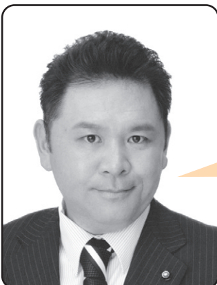
稲葉 晃司 議員