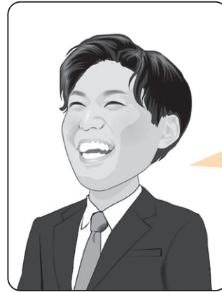
仲亀 恭平 議員