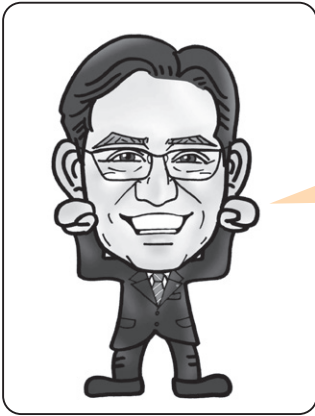
齋藤 和文 議員