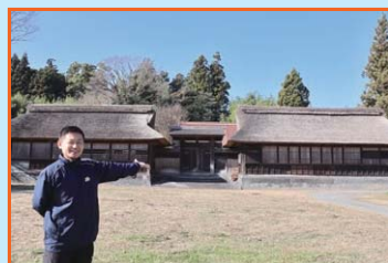
⑤ 井出家高麗門・長屋 この辺りに富士の巻狩で源頼朝が置いた宿があったといわれる