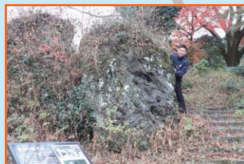
① 曾我の隠れ岩 曾我兄弟が身を潜め父を殺した工藤祐経の討ち入りを相談したといわれる