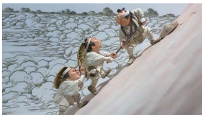
▲山梨県立富士山世界遺産センターには、江戸の富士講信者の富士登山の様子が展示されています