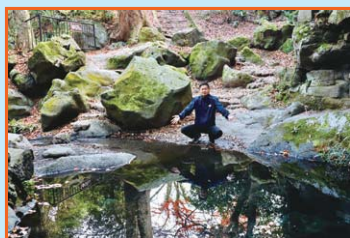
⑦ お鬢水 富士の巻狩で源頼朝が髪の毛を直したといわれる