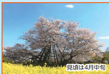
⑥ 狩宿の下馬桜 (特別天然記念物) 源頼朝が馬から下りたところといわれる 見頃は4月中旬