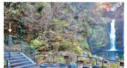
▲食行身禄の石碑は、今も白糸の滝の滝つぼの左手前に残されています。

身禄が亡くなって100回忌(天保3(1832)年)には、彼を慕う富士講の人たちによって「食行身禄」と書かれた石碑が建てられました。