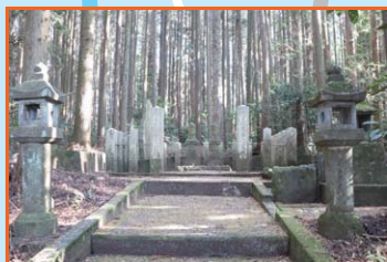
③ 曾我兄弟の霊地 曾我兄弟の兄(曾我十郎祐成)が、新田四郎忠常に討たれた場所といわれる