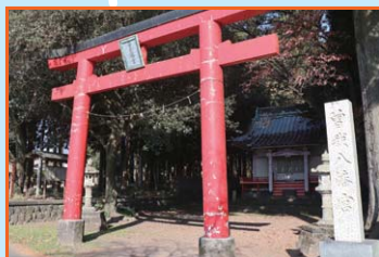
④ 曾我八幡宮 建久8(1197)年に源頼朝が曾我兄弟を祀らせたといわれる