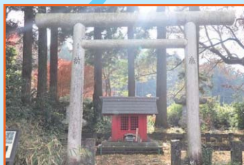
② 工藤祐経の墓 曾我兄弟に討たれた源頼朝の家来の墓