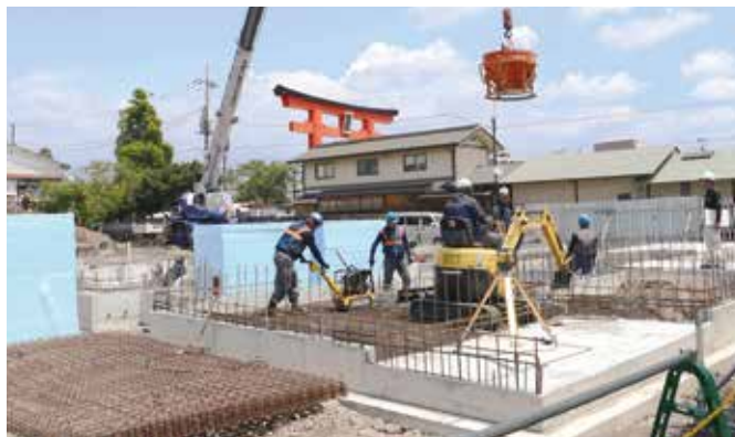
▲浅間大社西側市有地整備事業 市有地を活用し、民間事業者がカフェ・レストランを建設しています。(来年春オープン予定)