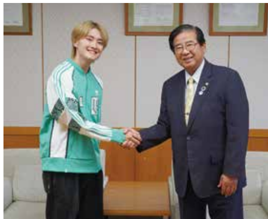
▲令和5年6月。須藤市長に活動内容や今後の展望などを報告。