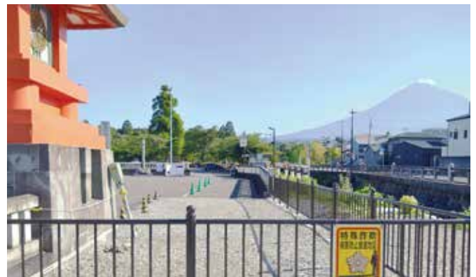
▲宮町交番跡地等整備事業 神田川右岸の一部に清流を愛でながら歩ける歩道を整備します。(12月に完成予定)