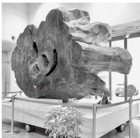
ロビーを飾る白糸神代杉

最近、国内の杉が「たわ み」や「曲げ」「強度」と いった点で外材よりも優れて いるというところで杉の集成材 が注目されているそうです。 そんな中、需要面では、唯一 バイオマス発電燃料用のチツ プ向けが底堅く価格も維持気 味と単純には喜ばない情報も あります。