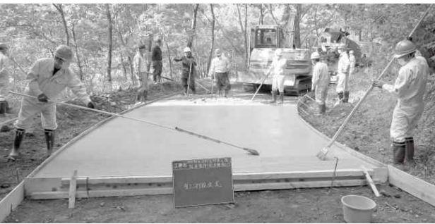
白糸財産区議会議員による路面整備奉仕作業

日本では一部を国産材に代 替える動きもありますが、 今までの輸入分を補うのは現 況の製材業者事情では不可 能とみられています。仕事柄、 大手のハウスメーカーと情報