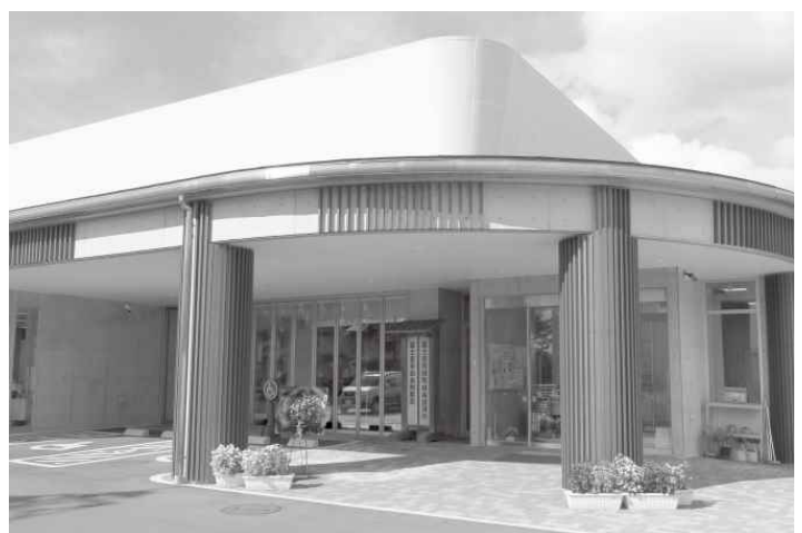
新装なった白糸会館 (令和3年4月)

富士地域森林県民円卓会議 も森林認証材の需要拡大に積 極的に取り組んでおられま す。作業現場の機械化と効率 化、後継者育成、ドローン活 用、林道整備も課題です。 「木材の利用促進に関する 法律」も十月から建物一般に 広がり、「脱炭素社会の実現 に資する木造化」は時代の潮 流となっております。