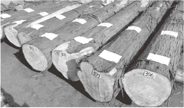
令和3年 協賛記念市（森林認証材）