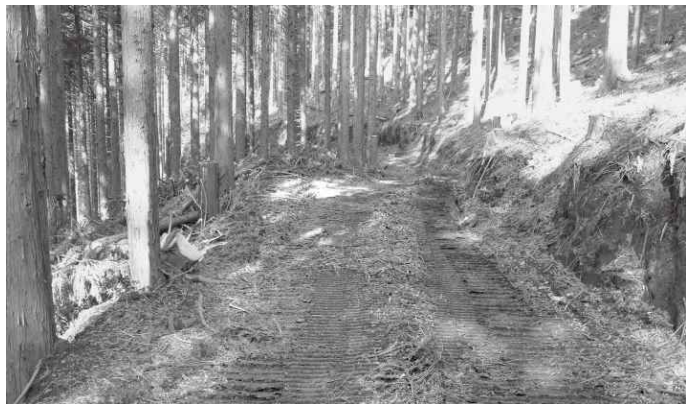
間伐業務による森林作業道開設（赤崩地先）