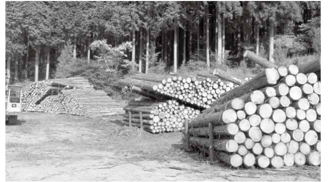
間伐業務による間伐材の積積状況（赤崩地先）

区民の皆様には日頃、白糸財産区の管理・運営にご理解とご協力を頂き誠にありがとうございます。