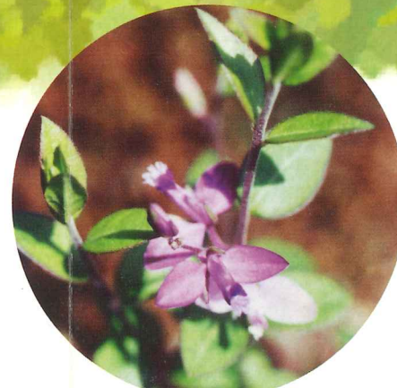
ヒメハギ 5月中旬~5月下旬