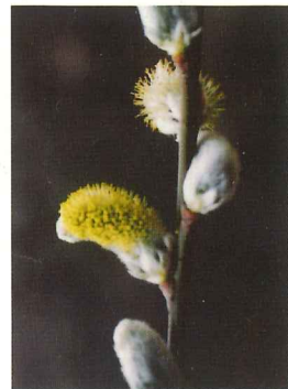
ヤマネコヤナギ 3月下旬~4月中旬