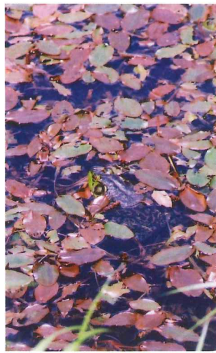
ヒルムシロ 5月中旬