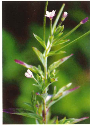
アカバナ 8月中旬～10月上旬