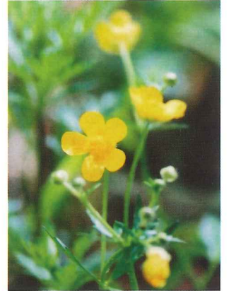
ウマノアシガタ 5月中旬~6月上旬