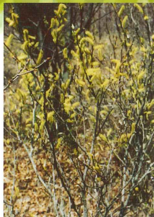
オオキツネヤナギ 4月中旬