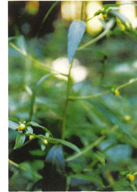
ガンクビソウ 8月下旬～11月上旬