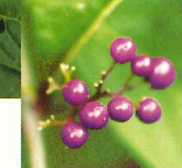
ムラサキシキブ果実