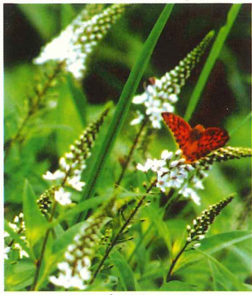
又トラノオ 7月上旬～8月中旬