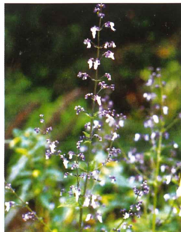
ヒキオコシ 9月下旬～10月中旬