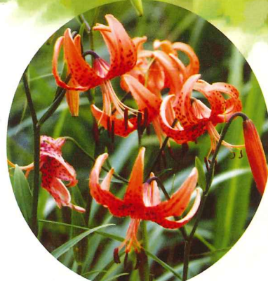
コオニユリ 7月下旬～8月下旬