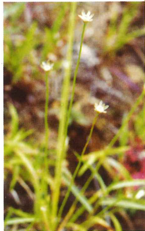
イトイヌノヒゲ 8月下旬～9月上旬