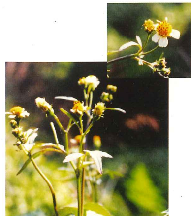
コシロノセンダングサ 10月上旬～10月中旬