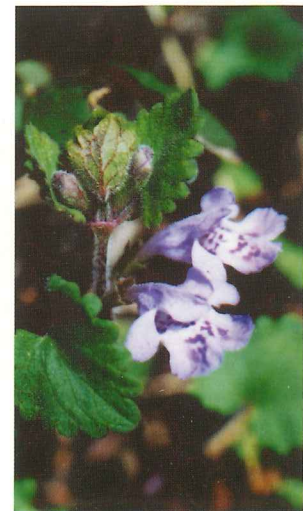
カキドウシ 4月上旬~5月中旬