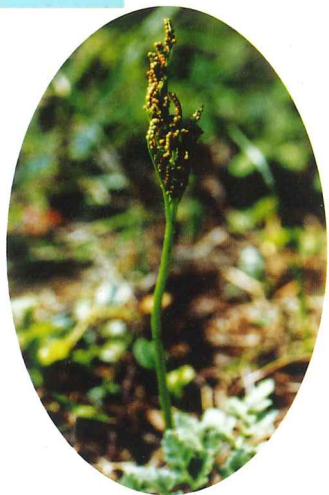
フユノハナフラビ