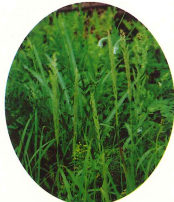
ヤマアワ 7月中旬～8月中旬