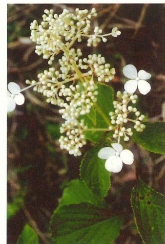
ノリウツギ 7月上旬～7月下旬