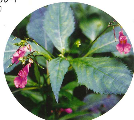
ツリフネソウ 8月上旬～10月上旬