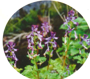
ムラサキケマン 4月中旬~5月中旬