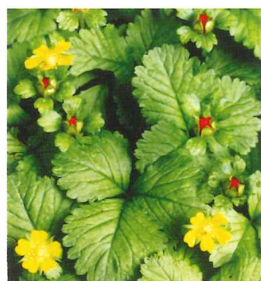
ヘビイチゴ 4月上旬~5月上旬