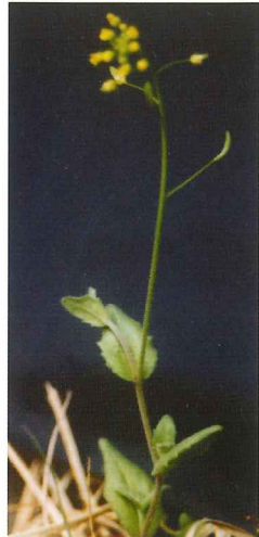
イナブズナ 4月中旬~4月下旬