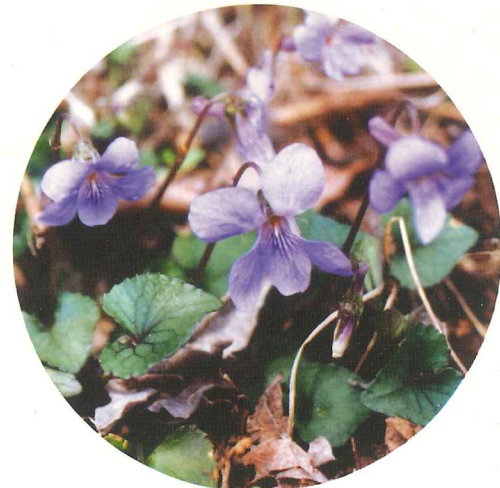
タチツボスミレ 4月上旬~5月中旬