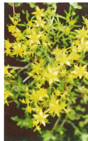
ヒメレンゲ 4月下旬~5月中旬