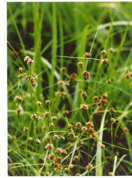
コマツカサスキ 8月上旬～8月下旬