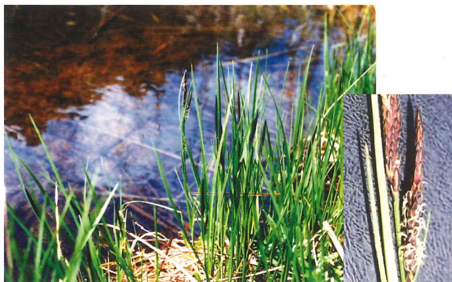
アゼスゲ 4月上旬~4月中旬