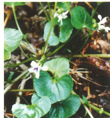
アギスミレ 4月中旬~5月上旬