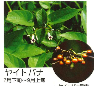
ヤイトバナ 7月下旬～9月上旬 ヤイトバナ果実