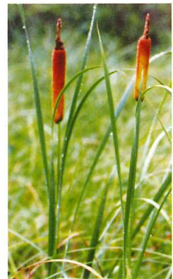
ガマ 7月下旬～8月中旬