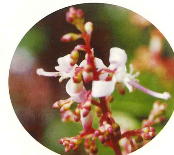
ホツツジ 7月中旬～9月下旬