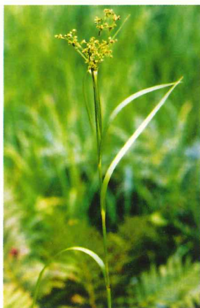
アブラガヤ 7月中旬～8月中旬