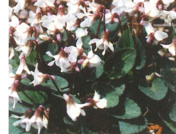
フモトスミレ 4月中旬