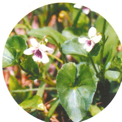
ツボスミレ 4月中旬~5月中旬