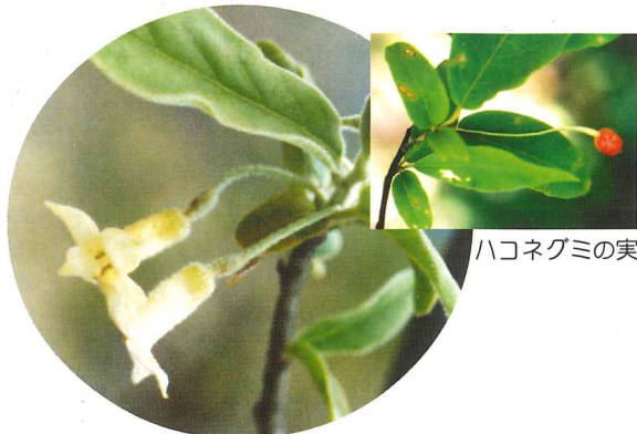
ハコネグミ 4月下旬~5月上旬