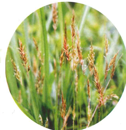
ハルガヤ 5月中旬~6月中旬