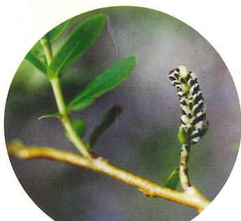
イヌコリヤナギ 4月中旬