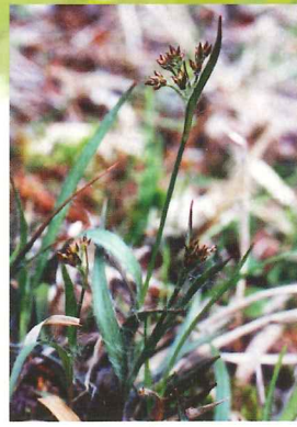
ヤマズメノヒエ 4月上旬~5月下旬