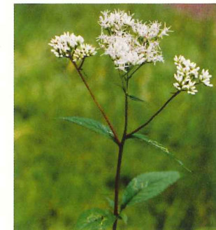
ヒヨドリバナ 7月中旬～10月上旬