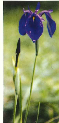
ノハナショウブ 7月上旬～7月下旬