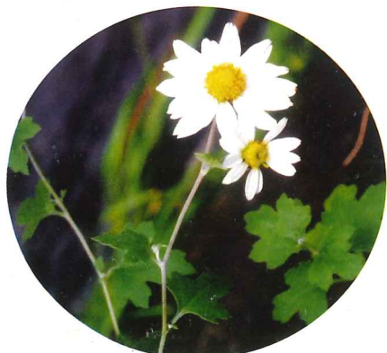
リュウノウギク 9月下旬～10月下旬