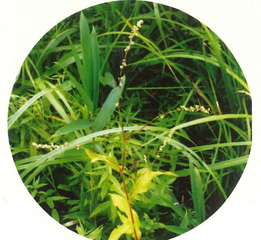
ネバリタデ 8月中旬～9月中旬