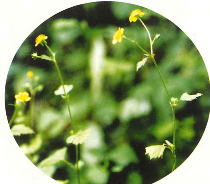
ダイコンソウ 7月中旬～8月下旬