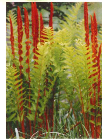
ヤマドリゼンマイ 5月中旬~5月下旬