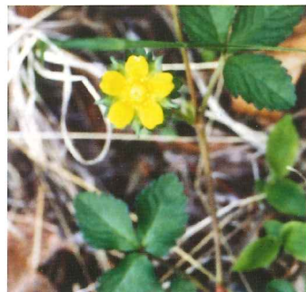
ミツバツチグリ 4月中旬~5月上旬