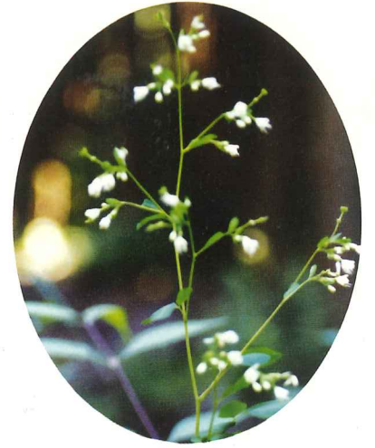
マツカゼソウ 8月下旬～10月下旬