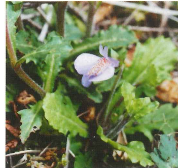
ムラサキサギゴケ 4月中旬~6月中旬