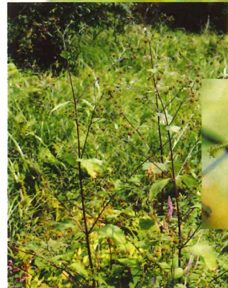
コメナモミ 10月上旬～10月下旬