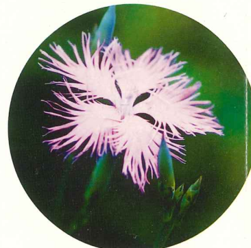
カワラナデシコ 7月中旬～8月下旬