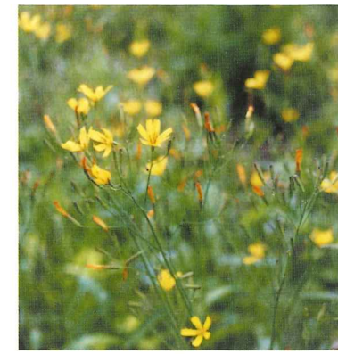
ニガナ 5月中旬~6月上旬