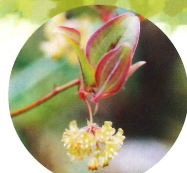
サルトリイバラ 5月上旬~5月下旬