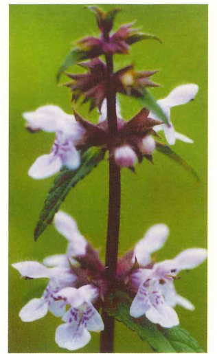
イヌゴマ 7月上旬～10月中旬