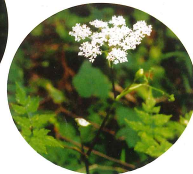
シラネセンキュウ 10月上旬～10月下旬