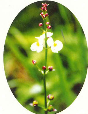
アギナシ 8月上旬～8月下旬