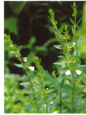
ヒメナミキ 7月中旬～8月中旬