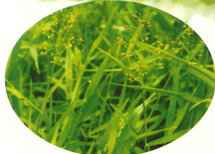
チゴザサ 7月上旬～7月下旬