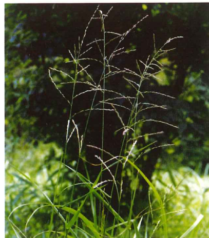
トダシバ 8月上旬～9月下旬