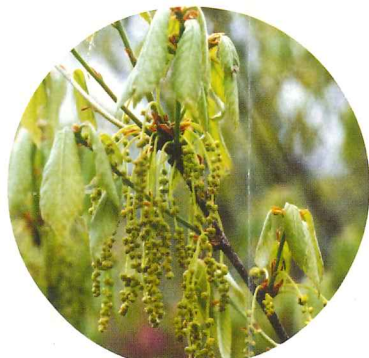
コナラ 4月下旬~5月上旬