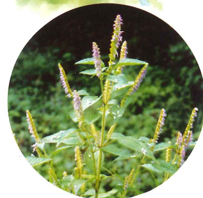
ナギナタコウジュ 10月上旬～10月下旬