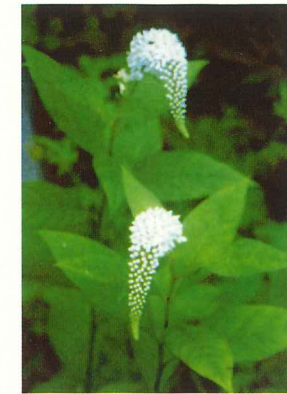
オカトラノオ 7月中旬