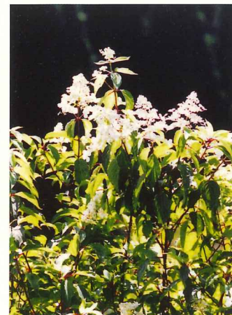
リョウブ 7月上旬～7月下旬