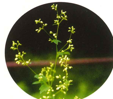
アキカラマツ 8月中旬～9月下旬