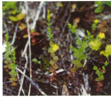
コケオトギリ 8月上旬～8月下旬