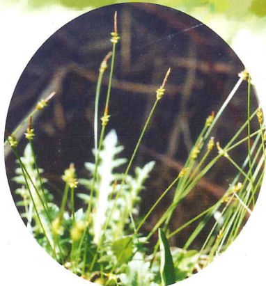
マツバスゲ 4月中旬