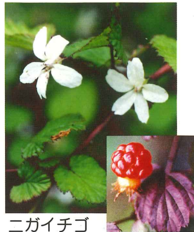
ニガイチゴ 4月下旬~5月中旬 ニガイチゴの実