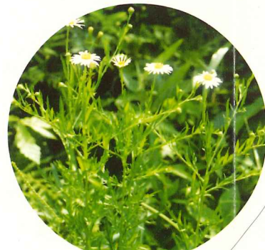
ユウガギク 6月下旬～11月上旬