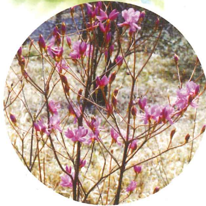
ミツバツツジ 4月中旬~5月中旬