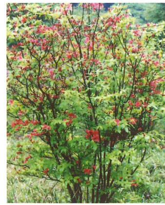
ヤマツツジ 5月中旬