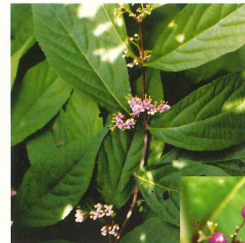
ムラサキシキブ 6月下旬～7月中旬