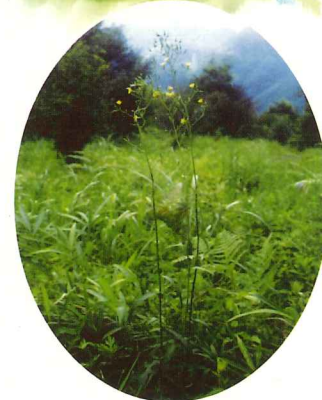
ヤマニガナ 8月中旬～9月上旬