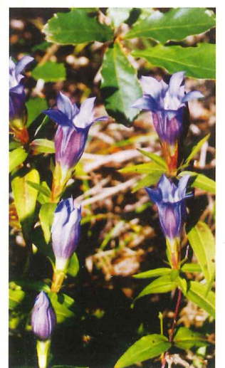
リンドウ 10月中旬～11月中旬