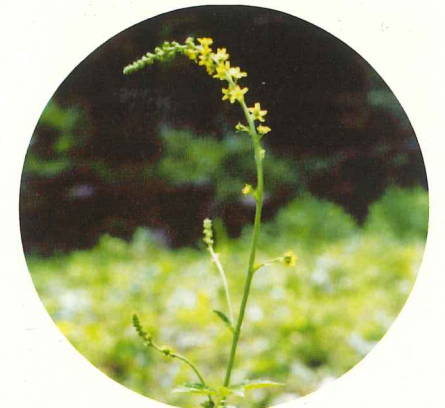
キンミスヒキ 7月中旬～10月中旬