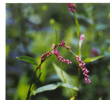
イヌタデ 9月上旬～10月下旬