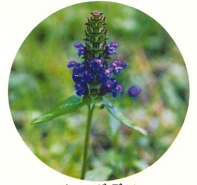
ウツボグサ 7月中旬～8月下旬