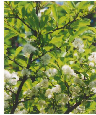
サウフタギ 5月中旬~6月上旬