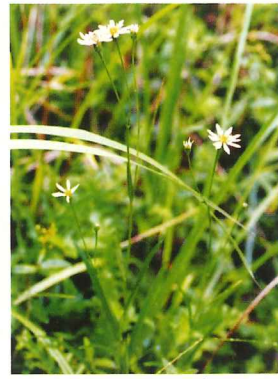
サワシロギク 8月上旬～10月中旬