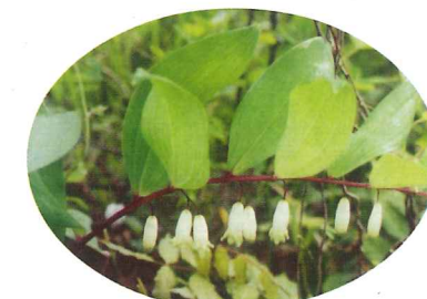
アマドコロ 5月下旬