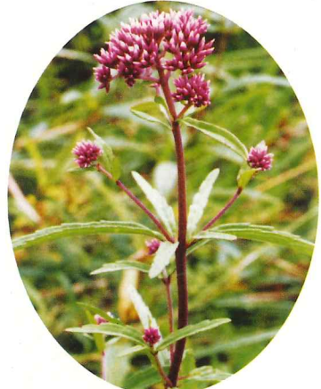
サワヒヨドリ 7月下旬～10月上旬