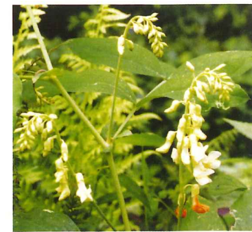
イタチササゲ 8月中旬～8月下旬