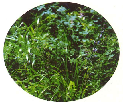
アキノタムラソウ 7月下旬～10月中旬