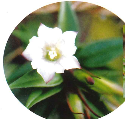
ツルリンドウ 10月下旬～11月上旬