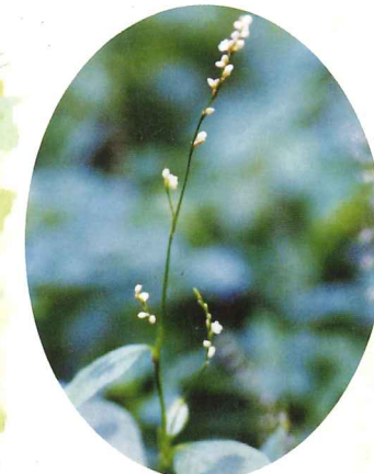
ハナタデ 9月中旬～10月中旬