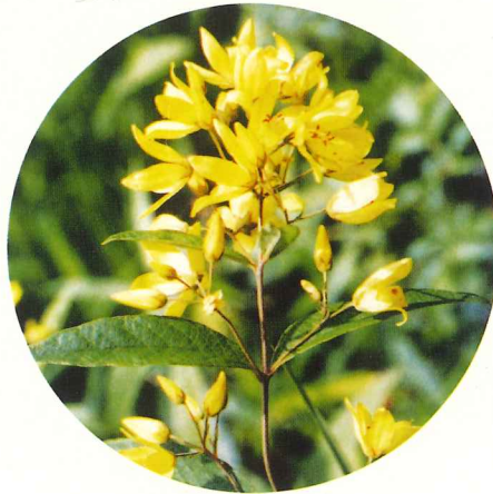
クサレタマ 7月上旬～8月中旬