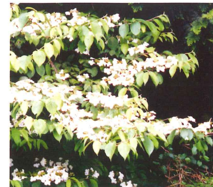
ヤブデマリ 5月中旬~5月下旬