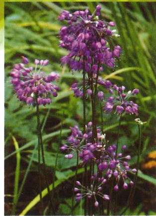
ヤマラッキョウ 10月上旬～10月下旬