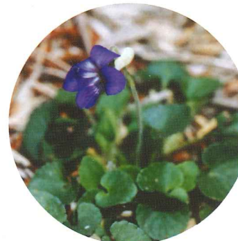
ニオイタチツボスミレ 4月上旬~4月中旬