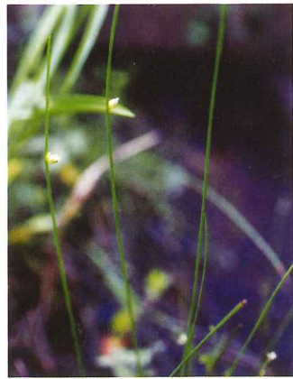
イヌホタルイ 8月上旬