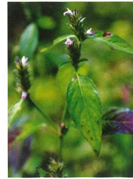
キツネノマゴ 8月上旬～10月下旬