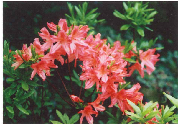
レンゲツツジ 5月中旬