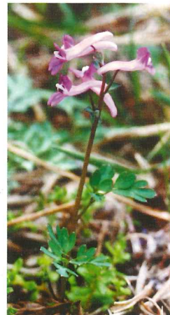
ジロポウエンゴサク 4月中旬~4月下旬