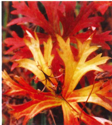
アサマフウロ 紅葉と果実