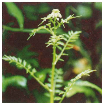
ジヤニンジン 5月中旬