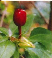
ツルリンドウ果実