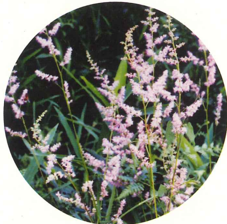
チダケサシ 7月中旬～7月下旬