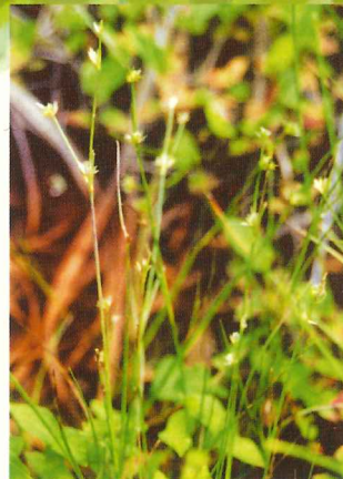
アオコウガイゼキショウ 6月下旬～7月上旬