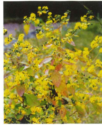
ヤクシソウ 10月上旬～10月下旬