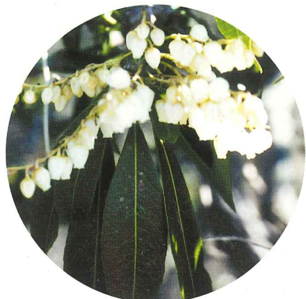
アセビ 3月中旬~4月中旬