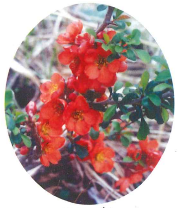
クサボケ 4月下旬~5月中旬