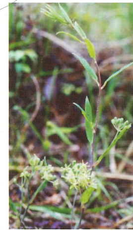
タチシオデ 5月中旬