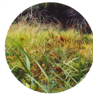
ヨシ 9月中旬～10月下旬