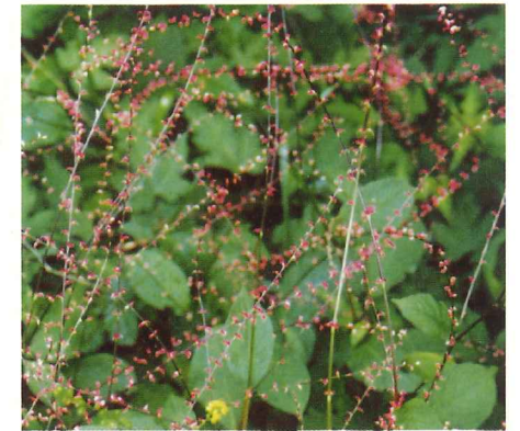
ミズヒキ 8月上旬～10月下旬