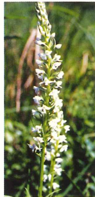
ミスチドリ 6月下旬～7月下旬