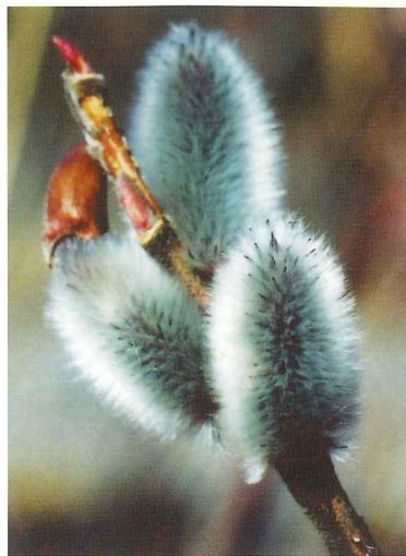
ネコヤナギ 3月中旬~4月上旬