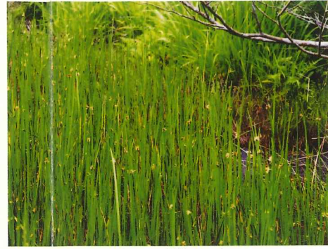
カンガレイ 8月上旬～8月下旬