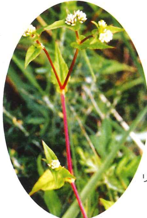
タニソバ 9月中旬～10月中旬