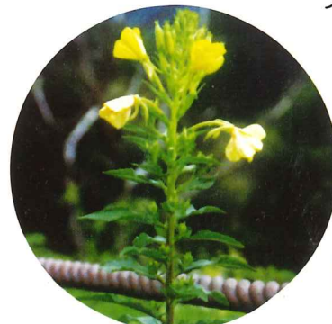
オオマツヨイグサ 9月上旬～10月中旬