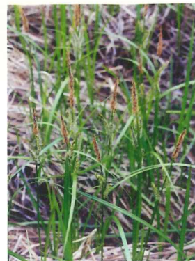
カサスゲ 4月中旬~5月中旬