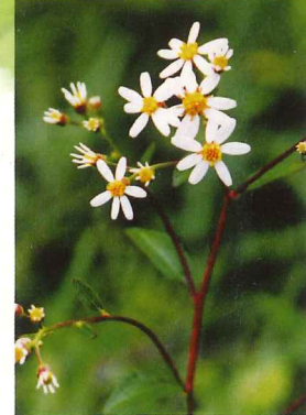
シラヤマギク 10月上旬～10月下旬