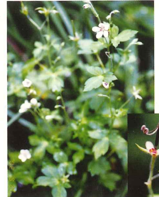
ゲンノショウコ 8月上旬～10月下旬 ゲンノショウコ果実