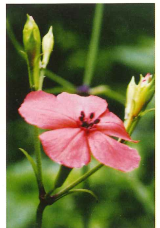
フシグロセンノウ 8月上旬～9月上旬