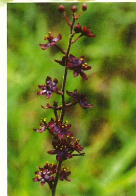
ホソバシユロソウ 8月下旬～9月上旬