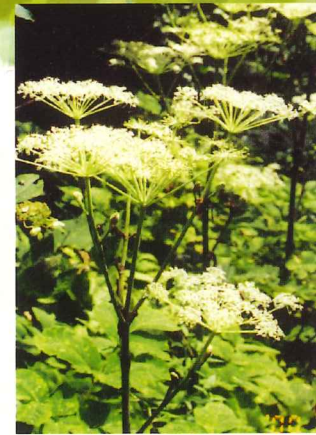
シシウド 7月下旬～9月中旬