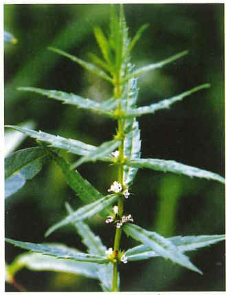
ヒメシロネ 7月中旬～9月下旬