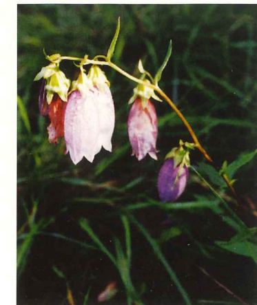
ホタルブクロ 7月中旬～8月下旬