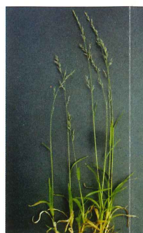
ネヅミガヤ 9月中旬～10月中旬