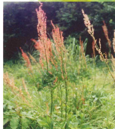
スイバ 5月中旬~6月上旬