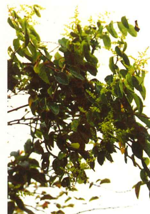
クマヤナギ 8月上旬