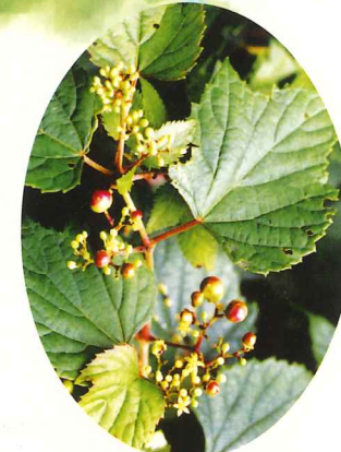
ノブドウ 7月下旬～8月下旬