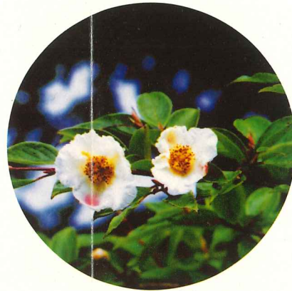
ナツツバキ 7月上旬～7月下旬