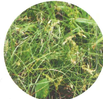
ミノボロスゲ 5月中旬~5月下旬