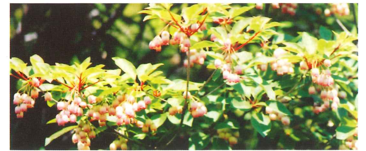
サラサドウダン 5月中旬~5月下旬