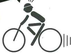
自転車事故死者の人身損傷部位 (過去10年・平成25年~令和4年・静岡県内)