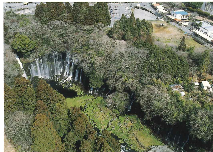
Shiraito no Taki Waterfalls (aerial view)

白线瀑布是因富士山的积雪融化并涌出从而成为了瀑布,其名字正是来自涌出的水流下时如垂落的白线般优美的景色。白线瀑布与相邻的音止瀑布在地质学方面非常宝贵,因此被指定为国家名胜以及天然纪念物。