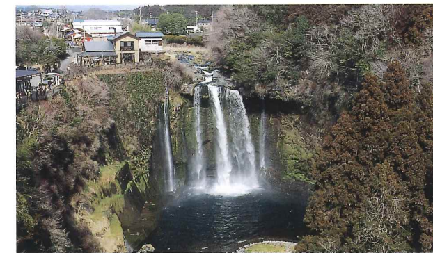
Otodome no Taki Waterfalls (aerial view)

相传在距今约800年前,曾我兄弟在此瀑布附近商量复仇之事时,当说到瀑布声音太吵杂没办法说话时,瀑布的声音突然静止,从而得名为音止瀑布。