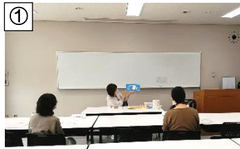
【受託会員講習会の様子】