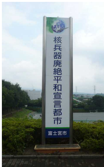
②富士宮市民体育館