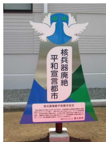
⑩富士宮市立児童館（らっこ）