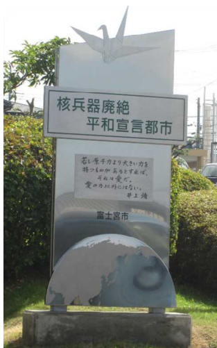
⑧富士宮市総合福祉会館