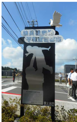
⑨富士宮市学校給食センター