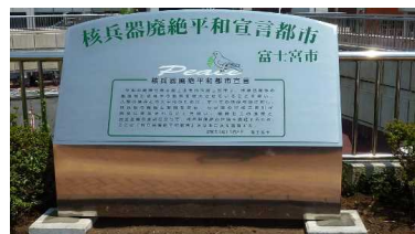
④駅前ペDESTリアンデッキ