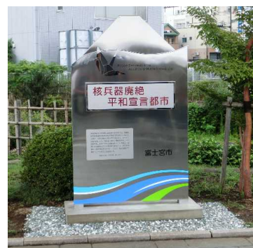
⑦富士山せせらぎ広場